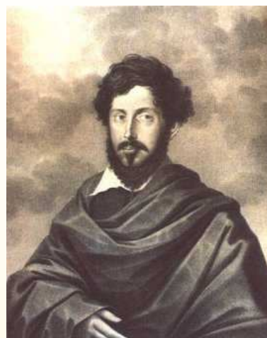
Almeida Garrett 1799 — 1854

Porque tu és o Ideal Da só beleza - do Bem; Não és estranha a ninguém, E de ti só foge o mal Que te não pode encarar.